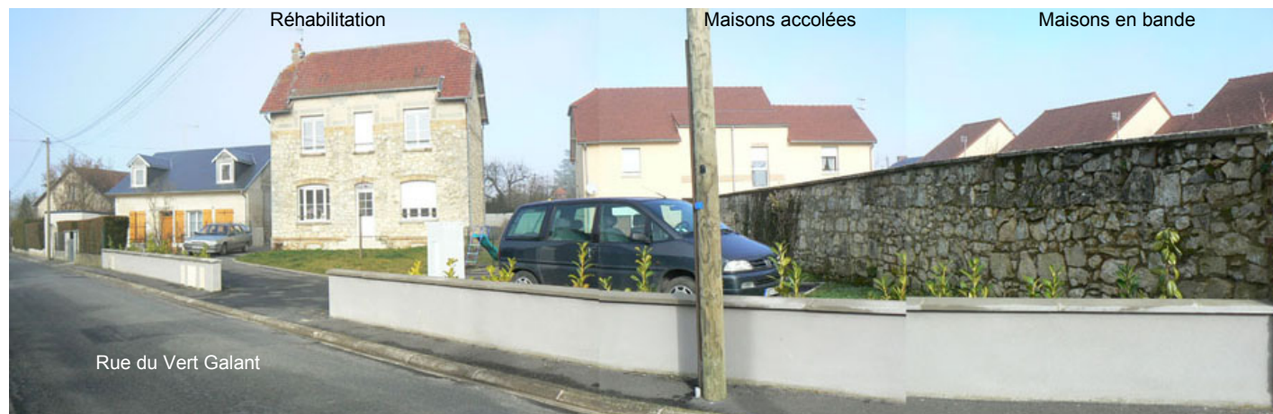
trois formes urbaines intègrent les aspects patrimoniaux et forment un ensemble cohérent.

L'esprit du mur d'enceinte d'origine est repris par l'utilisation systématique de murets. Ces derniers matérialisent la limite espace public/espace privé mais, par leur faible hauteur, laissent le regard s'étendre au-delà ; évitant l'impression d'enfermement. Sobres et discrets, ils permettent également d'intégrer harmonieusement les éléments techniques (coffrets, boîtes aux lettres). Du fait du recul des nouvelles façades par rapport à l'alignement, ils participent au maintien de la lecture du gabarit de la rue.