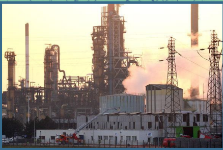
Fort-Mardyck, établissement Seveso