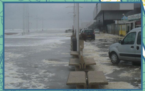
Inondation de la digue-promenade de Malo-les-Bains en février 2009