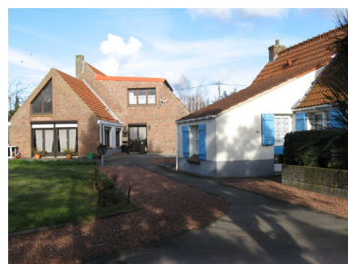
L'urbanité, la convivialité et la diversité des ambiances