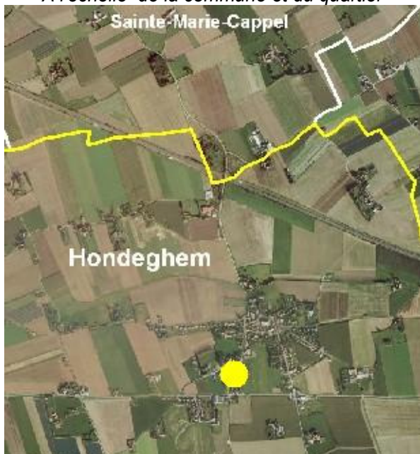
A l'échelle de la commune et du quartier