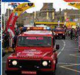
MINISTÈRE DE L'INTÉRIEUR