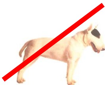
BULL TERRIER (museau droit)

CHIENS NON POTENTIELLEMENT DANGEREUX (molosses n'appartenant pas aux catégories des chiens dangereux, pas de déclaration en mairie, pas de vaccination la rage obligatoire)